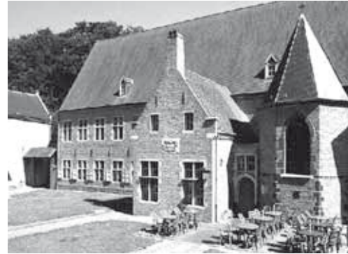
Infirmerie du béguinage de Diest (Flandres) →

La béguine malade, indigente ou âgée peut bénéficier de la solidarité de la communauté : elle a l'opportunité de se retirer dans un hospice où elle pourra finir ses jours en toute quiétude. La solidarité entre femmes indépendantes est certainement une des plus grandes originalités de ce mode de vie. Dans les grands béguinages, l'infirmerie est distincte, parfois complétée d'une ferme et d'une brasserie. Des règles précises y sont adoptées. Ainsi, en rejoignant ce lieu, la béguine abandonne son statut pour devenir une « Kranken », une malade en dépendance. Elle s'engage à lui léguer ses biens, en tout ou en partie, et elle y sera soignée jusqu'à son décès dans une salle commune avec chapelle, similaire à ce qu'on trouve dans toutes institutions hospitalières médiévales. Une maîtresse particulière est chargée de la gestion de l'infirmerie ; elle dirige aussi souvent la Table du Saint-Esprit qui vient en aide aux béguines nécessiteuses.