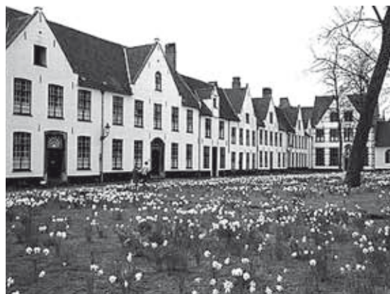
Maisons de béguinage à Bruges ↑ et à Lierre ↓

Malgré l'absence de clôture canonique, les béguines sont tenues de résider dans l'enclos et d'y passer la nuit. Contrairement aux religieuses, elles ne font pas vœu de pauvreté et restent propriétaires de leur patrimoine. Elles peuvent en conséquence posséder un bien, recevoir des legs ou faire des testaments, même si une partie de leurs avoirs reviendra automatiquement à l'institution. La maison qu'elles occupent constitue certainement un des éléments les plus importants de ce patrimoine familial, au point que des dynasties de béguines sont créées pour la transmettre de tante à nièce.