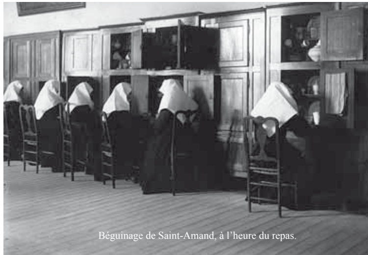
Béguinage de Saint-Amand, à l'heure du repas.

Les béguines se placent sous la direction d'une supérieure nommée "Grande Dame", élue tantôt pour la vie, tantôt pour une durée limitée. Sa position lui vaut une maison de prestige qui est souvent la demeure la plus importante de l'enclos, la groothuis .